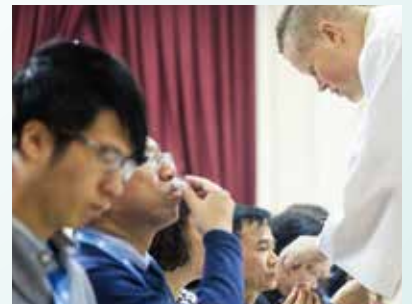
世界信義宗聯會- 亞洲區教會領袖會議開幕式暨聖餐崇拜