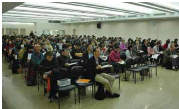
感謝主！3/9APELT研習會，共217位來賓與會

最後，我們怎麼持續活在聖靈裏？只要透過我們持續地藉著基督的道，領受聖靈（弗五：18）。弗三：16, 17, 19「求他按著他豐盛的榮耀，藉著他的靈，叫你們心裏的力量剛強起來，使基督因你們的信，住在你們心裏…並知道這愛是過於人所能測度的，便叫上帝一切所充滿的，充滿了你們。」換句話說：你越被上帝的話充滿，你就同時越被聖靈充滿。被基督的愛、話、及同在充滿就是被聖靈充滿！路德對神的話本身有深刻的靈命力量作了以下的見證：「我用主禱文禱告時，有的時候我的腦海充滿了太多美好的思路。這樣的情況發生時，我們應該漠視其他（主禱文的）禱告，注意這些思路，安靜的聽，千萬不要妨礙他們。聖靈親自在那裏講道，祂講的一句話超越我們的一千個禱告。常常我從一個禱告學到的遠遠超過從讀很多書學到的屬靈功課」（LW 43. 198）。願上帝使祂的聖靈，透過祂寶貴的話語，充滿、堅固、及安慰我們這種不配的罪人！