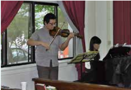
宣教募款-咖啡吧音樂欣賞