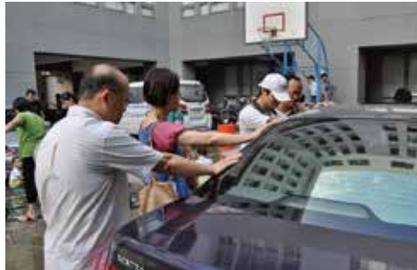
宣教募款-洗車代禱