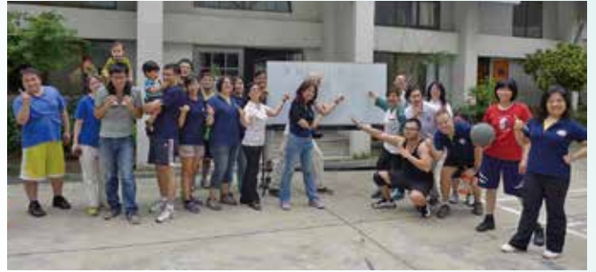
路德盃-籃球比賽冠軍鑽石隊