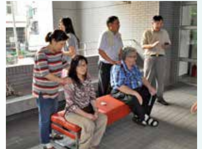
宣教募款-按摩專區